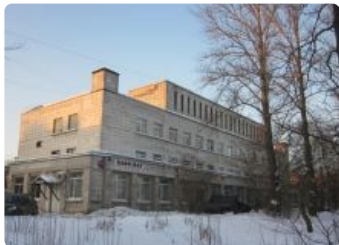
Баня № 1