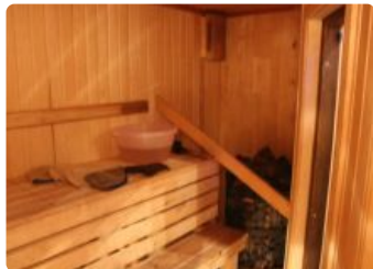
Семейная баня-VIP в Пушки