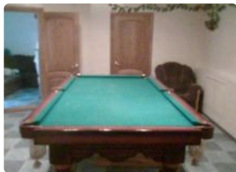
Сауна У Лехи