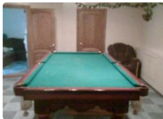
Сауна У Лехи