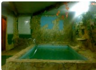
Русская баня с веником