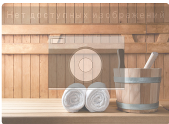
Сауна Ангарный 8