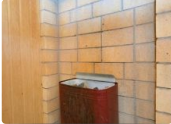
Сауна гостиничного комплекса