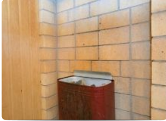
Сауна гостиничного комплекса