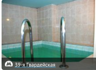
М 39-я Гвардейская