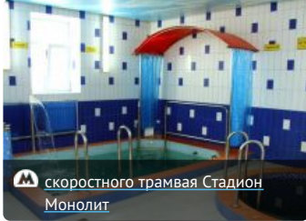
М скоростного трамвая Стадион Монолит