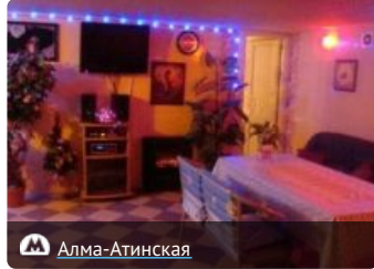
Сауна в Братеево