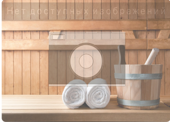
Сауна в спортивно-оздоровитель