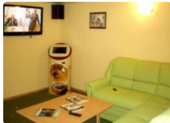
Сауна на Привольной