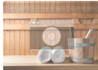
Сауна в Люберцах