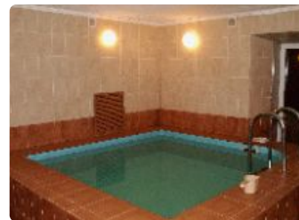
Сауна в Оздоровительном компле