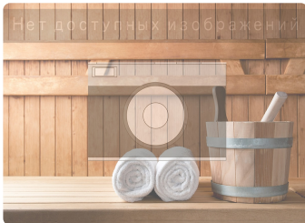
Финская сауна при СОК Два